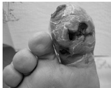
شکل ۱- زخم به هنگام مراجعه

هفته کاملاً بسته شد. بعد از این مدت دیگر مریض از پماد موضعی استفاده نکرد و فقط رعایت موارد بهداشتی را درمورد زخم پا انجام می‌داد. بعد از رویش بافت جدید و بسته‌شدن زخم و قطع درمان با پماد موضعی، وضعیت بیمار به مدت ۲ ماه پیگیری شد و هیچ‌گونه عودی مشاهده نگردید.